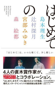
はじめての 著・人気作家4名