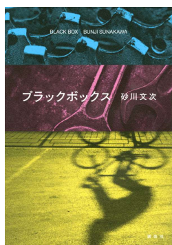
第166回芥川賞 ブラックボックス 著・砂川文次