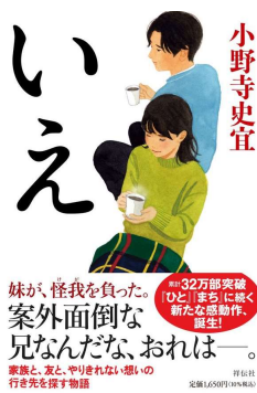
いえ 著・小野寺史宜