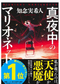
真夜中のマリオネット 著・知念実希人